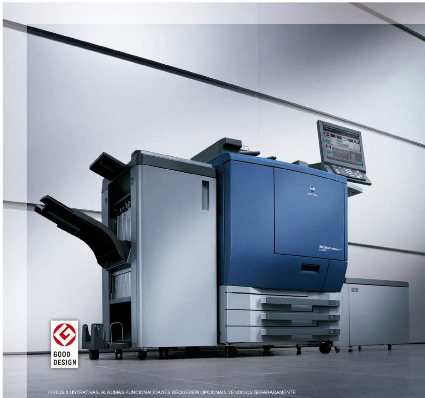
FOTOS ILUSTRATIVAS. ALGUMAS FUNCIONALIDADES REQUEREM OPCIONAIS VENDIDOS SEPARADAMENTE